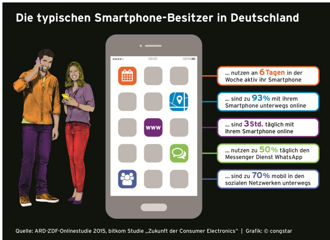
Bildunterschrift 4: Die typischen Smartphonebesitzer in Deutschland.